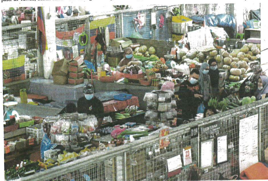
PENIAGA dan pembeli melakukan urusan niaga di sekitar Pasar Sentral UTC, Labuan, semalam.

"Punca jangkitan masih dalam siasatan," katanya.