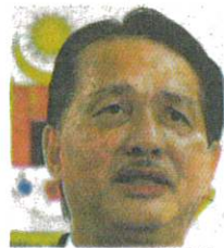
Dr Noor Hisham Abdullah

ke-133 (kes ke-9224) membabitkan lelaki warga tempatan berusia 72 tahun dengan latar belakang penyakit strok yang dikesan sebagai kontak rapat kepada kes ke-9,124 (sudah meninggal dunia) dan kes positif dalam Kluster Tawau.