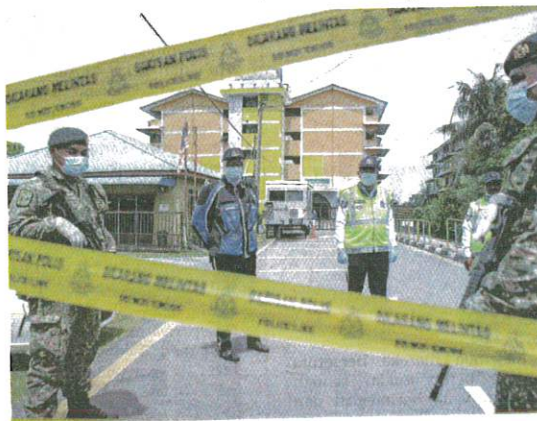
ANGGOTA polis dan tentera mengawal ketat Rumah Pangsa Tongkang Yard, Seberang Perak, Alor Setar sejak semalam.

"Kawasan rumah kini dalam kawalan ketat pihak polis dan tentera bagi mengelakkan jangkitan menjadi lebih serius," katanya ketika dihubungi di sini