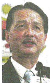
Tan Sri Dr Noor Hisham Abdullah

On the laboratory preparedness in Sabah, he said under the Health Ministry, there were 23 hospital laboratories and 26 clinical laboratories in the state that performed the Rapid Test Kit-Antigen (RTK-Ag) test, which could detect the Covid-19 infection on a large scale.